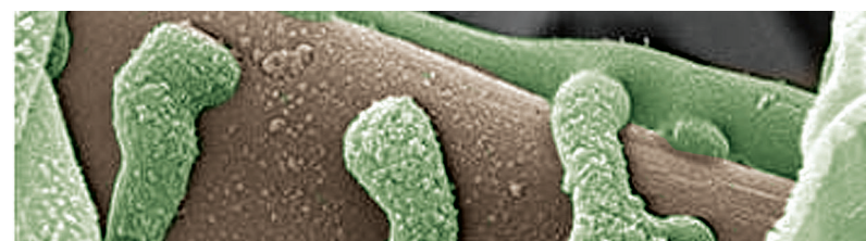
C. rosea J1446 kiertyneen taudinaiheuttajasienen ympärille

Clonostachys rosea J1446 tunkeutuu taudinaiheuttajasieniin ja hajottaa niitä aineenvaihduntatuotteillaan.