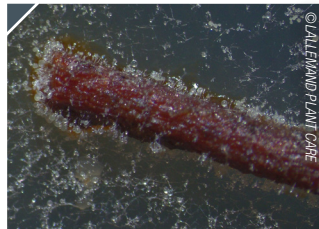
C. rosea J1446 mansikan juuristossa

Clonostachys rosea J1446 asuttaa tehokkaasti kasvien juuret, lehvästön ja kukat.